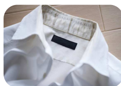
汗ジミなどのしみ汚れに