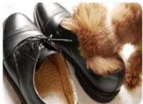
革靴、ブーツ スニーカー等の臭い