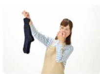
靴下の蒸れた臭い