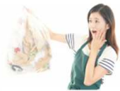
生ゴミなどの臭い