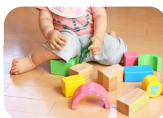
おもちゃの洗浄・除菌に