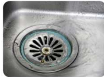
排水溝からの臭い